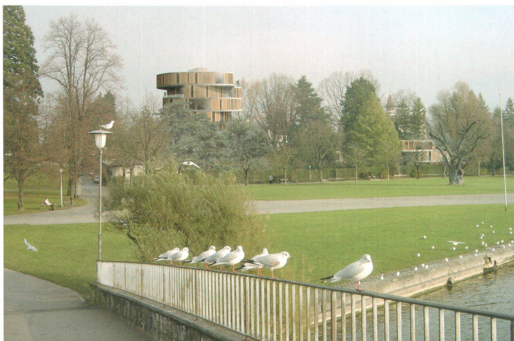
Fotomontage der geplanten Häuser am Graben und zur Promenade auf dem westlichen Teil des Schlossparks, gemäss Projektstand 2005 (Pressebild)

private Vorhaben politisch möglichst breit abzustützen, wurde die zweijährige Entwicklungsphase von einer grossen Gruppe mit Vertretern des Chamer Gemeinderats, der gemeindlichen Bauabteilung, der gemeindlichen Kommissionen, der kantonalen Denkmalpflege, der kantonalen Raumplanung und der kantonalen Natur- und Landschaftskommission begleitet. Entsprechend haben sie zum Projekt und Bebauungsplan Schloss und Park St. Andreas euphorisch Stellung genommen. Ob bei dieser seit Beginn der Projekt-Entwicklung intensiven Einbindung von Behördenvertretern dann deren für die Amtsgeschäfte verlangte Unabhängigkeit und Objektivität noch gewährleistet sind, wurde bereits beim Blick auf das Architekturmodell mit dem zugestandenen gewaltigen Neubauvolumen bezweifelt. Im überarbeiteten Bebauungsplan 2006 sind die gleich gebliebenen Bruttogeschossflächen von rund 10000 Quadratmetern von den einst drei auf marktkonforme vier Bauten verteilt. Im