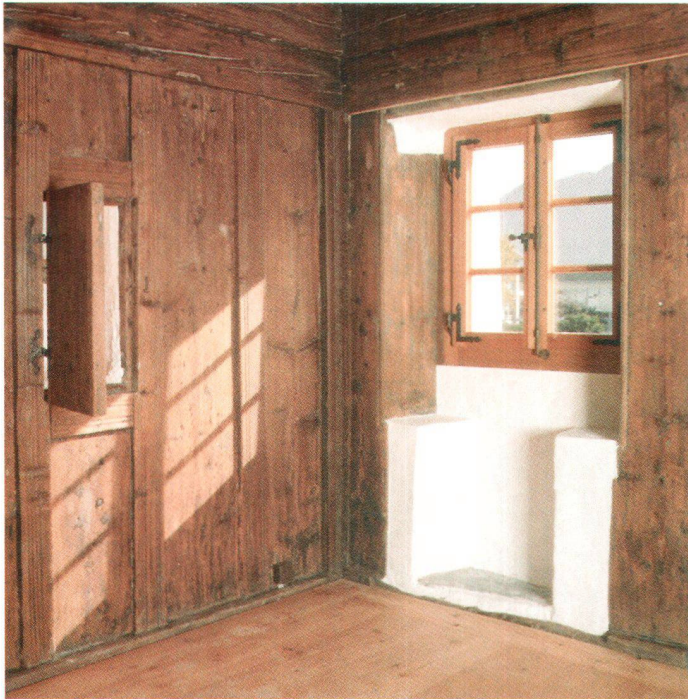
L'ambiance chaleureuse de la maison Rossier est accentuée par des matériaux tels que le bois, la pierre naturelle et la chaux

Denn Reno Pianos «drei Wellen» sei eine prägnante Auseinandersetzung mit dem Maler und dem Gegensatzpaar Natur-Kultur, weshalb ihre Sektion voll und ganz hinter diesem modernen Bau stehe. Als eines der grössten Anliegen der Sektion bezeichnete sie denn auch den Brückenschlag zwischen Altem und Neuem. «Wir wollen wertvolle alte Bausubstanz in das moderne Alltagsleben mit einbeziehen, suchen zukunftstaugliche Lösungen und beschäftigen uns deshalb mit Fragen der Umnutzung.» Die Gründung des Berner Heimatschutzes durch einen Kreis um Otto von Greyerz im Februar 1905 sei eine Reaktion auf die ersten negativen Auswirkungen des technischen Fortschritts gewesen. Heute könne die Sektion mit ihren 3200 Mitgliedern stolz auf eine erfolgreiche Tätigkeit zurückblicken. Doch es stünden ihr bewegte Zeiten und neue Herausforderungen bevor, meinte sie weiter und nannte dabei namentlich den ungebremsten Bodenverschleiss, die nur mangelhaft erfassten Schutzobjekte des 20. Jahrhunderts und das bedrohte Verbandsbeschwerderecht. Gleichzeitig plädierte sie für eine professionelle Öffentlichkeitsarbeit, vereinsinterne Reformen und Partnerschaften mit Dritten. – Andreas und Raphael Urweider umrahmten die Feier mit einem poetisch-musikalischen Dialog zum Thema «Heimat», eine von Peter J. Aebi redigierte Festschrift, Führungen durch das Klee-Zentrum und ein Bankett ergänzten den Jubiläumsanlass.