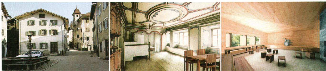
Ständerat machte in Valendas «Ferien im Baudenkmal»