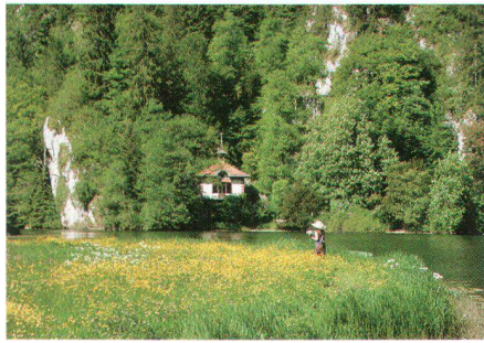
Die «Maison du Sonneur» am Doubs-Ufer La Maison du Sonneur sur les rives du Doubs

De la fin du XIX e siècle à la Première Guerre mondiale, l'activité est intense aux Sonneurs. Les associations, sociétés patriotiques, musicales et sportives s'y succèdent. Les politiques aussi en font leur lieu de réunion pour débattre de grands projets (pont de Biaufond édifié en 1881, pont de la Rasse en 1893, ligne ferroviaire Saint-Hippolythe–La Chaux-de-Fonds qui ne verra jamais le jour!). Le 20 juillet 1880 demeure le jour faste par excellence dans les