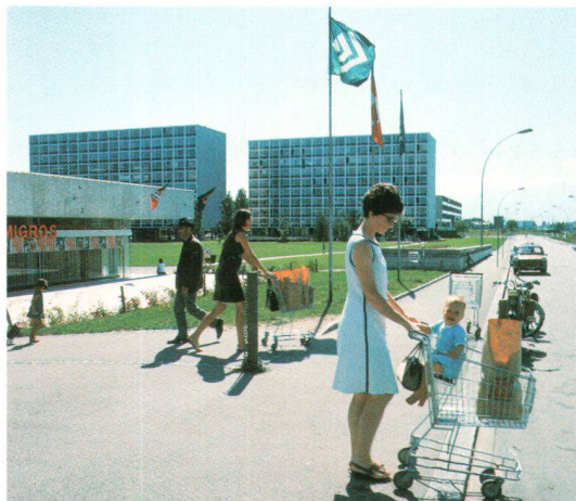
Einkaufszentrum der Cité satellite in Meyrin, 1967

Von der Rationierung im Krieg bis hin zum Tiefkühlmenü, das man ganz einfach aus dem Gefrierschrank nehmen und in den Ofen schieben kann, haben sich die Lebensbedingungen unglaublich verändert und verbessert. Aber zwischen diesen beiden Welten liegen nur wenige Jahre. Man kann sich deshalb gut vorstellen, welche Dynamik und Aufbruchstimmung die Gesellschaft der 50er- und 60er-Jahre geprägt haben. Jede Neuigkeit, jede Innovation war berauschend. Das Tempo dieser Entwicklung wurde jedoch immer schneller, bis im Mai 68 schliesslich neue Wertvorstellungen für Aufsehen sorgten. Die Hippiebewegung stellte das Verhalten der Konsumgesellschaft an den Pranger, die sich auf Kosten der Dritten Welt bereichert und diejenigen vergisst, die am Rande stehen und den Anschluss verpasst haben. Nach zwei Jahrzehnten der Ordnung kam schliesslich der Nonkonformismus zum Zug.