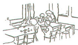
Abb. 14. Der Familientisch ist kein höherer Begriff, sondern eine Wirklichkeit, welche auf die Kinder gemeinschaftsbildend einwirkt.

Für die Zeitgenossen wohl wichtigster Punkt, auf den die an Bedeutung wachsende Landesplanung hinwies, war die simple Erkenntnis, dass der Raum als Ressource begrenzt war und somit haushälterisch mit ihm umzugehen war. So flächenintensiv, wie noch die Kriegssiedlungen geplant worden waren, durfte man nicht