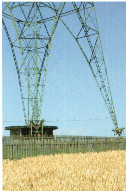
Kletterturm, Jugendradio oder Liebessender? Der Schweizer Heimatschutz sammelte Ideen zur zukünftigen Nutzung des Landessenders Beromünster

Vielfältig und originell waren die eingegangenen Vorschläge: Sie reichen von einer Umnutzung des Sendeturms zur Windenergiegewinnung über einen Umbau zum Kletterturm bis zur Installation eines «Liebessenders» in dem geheiratet und das Ja-Wort über den Sendeturm in den Äther geschickt werden kann. Die überzeugendste und realistischste Idee zeigt der Vorschlag «Radio aktiv +»: Dieser sieht vor, im Landessender Beromünster auch in Zukunft ein Radioprogramm zu produzieren. Schülerinnen und Schüler aus der ganzen Schweiz gestalten unter professioneller Anleitung ihre eigenen Projektwochen. Sie erlernen das Radiohandwerk auf dem heutigen technischen Stand und stellen Beiträge her, die über das neue Radio verbreitet werden – sei dies mit eigener Sendeleistung oder in Partnerschaft mit bestehenden Radiostationen. Allenfalls könnte ein historisches Radiomuseum mit alten Tondokumenten, Technik und sonstigem Archivmaterial entstehen, in dem gezeigt wird, wie in den Anfängen des Radios gearbeitet wurde. Die Infrastruktur für «Radio