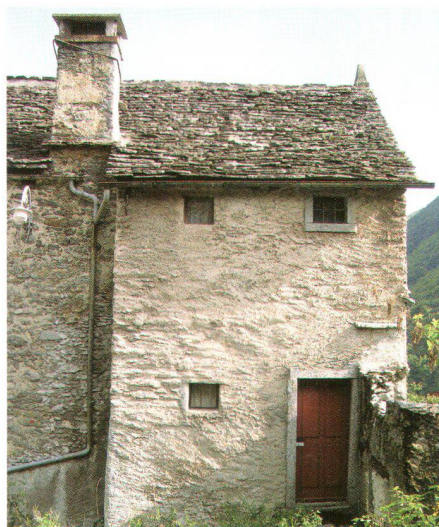
Casa Döbeli, Russo TI