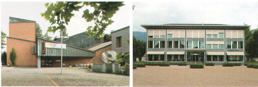
Links: Parktheater in Grenchen Rechts: Baloise Bank SoBa in Solothurn

Gauche: Le théâtre Parktheater à Grenchen Droite: La Banque bâloise SoBa à Soleure