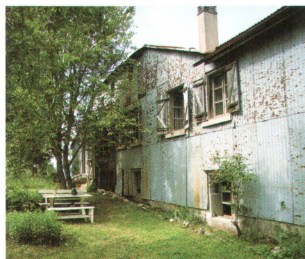
Les Mollards-des-Aubert, Le Brassus VD

Die Casa Döbeli in Russo im Onsernetal gehört der Tessiner Sektion des Heimatschutzes. Das einfache, zweistöckige Bürgerhaus aus dem 17./18. Jahrhundert vermittelt schlichte Eleganz. Die Loggia, welche auf der Südseite die Zimmer miteinander verbindet, sorgt für einen Hauch südlichen Lebensgefühls. Es ist geplant, noch diesen Sommer mit den Renovationsarbeiten zu beginnen, so dass ab nächstem Sommer darin zwei Wohnungen zur Verfügung stehen werden.