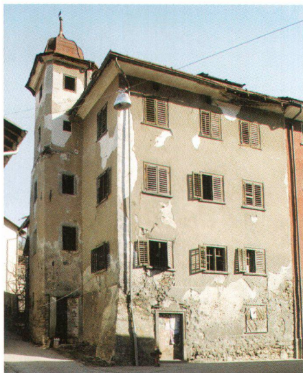
Türalihus, Valendas GR

Mitte Juli konnte die Stiftung als zweites Objekt das Türalihus in Valendas erwerben. Das herrschaftliche Gebäude mit einem markanten Treppenturm, dessen heutiges Aussehen auf das Ende des 18. Jahrhunderts zurückgeht, beeindruckt im Inneren mit reich ausgestatteten, getäfelten Stuben. In nächster Zeit geht es darum, die Arbeiten am stark renovationsbedürftigen Haus zu planen und die nötigen finanziellen Mittel zu suchen. Nach Abschluss der Arbeiten werden im Türalihus drei aussergewöhnliche Wohnungen zur Verfügung stehen.