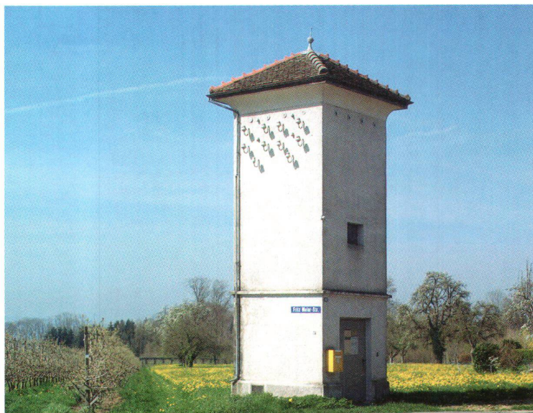
Trafostation Andhausen (Berg TG) Station de transformation d'Andhausen (Berg/TG)

Der Wettbewerb wurde im Frühling 2007 öffentlich ausgeschrieben. Die Ausschreibung