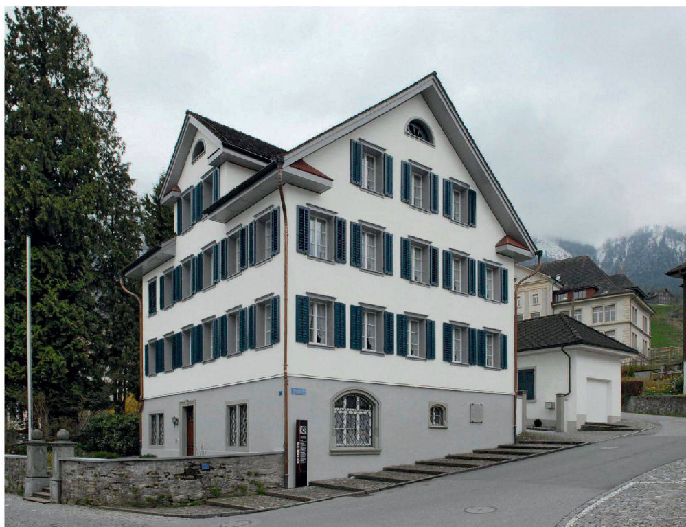
Stans, cure, Knirigasse 1, construction 1859–1860, architecte: Johann Meyer, Hergiswil. Vue depuis le nord-est

eine Aussendämmung naheliegend. Nachdem die Schindeln entfernt und die vorstehenden alten Nägel eingeschlagen waren, wurde eine diffusionsoffene Folie als Luftdichtung/Dampfbremse, eine Wärmedämmschicht aus 2350 mm dicken Mineralfaserplatten und eine Holzschalung appliziert. Aufgrund des guten Austrocknungsverhaltens des Schindelschirms konnten die Schindeln direkt auf die nicht hinterlüftete Holzschalung genagelt werden.