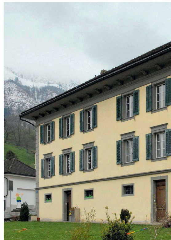
Stans, Kaplanenhaus, Knirigasse 2, Baujahr 1846, Ansicht von Nord-Osten (Bilder Fachstelle für Denkmalpflege Nidwalden)

Die vier Gebäude der katholischen Kirchgemeinde Stans stammen aus den Jahren 1691 (Sigristenhaus), 1720 (Organistenhaus), 1859 (Pfarrhaus) sowie 1846 (Kaplanenhaus) und dienen auch heute noch der Wohn- und Büronutzung. Die beiden älteren Häuser weisen typischerweise einen Sockel aus verputztem Bruchsteinmauerwerk, in Blockbauweise errichtete, verschindelte Oberbauten und Krüppelwalmdächer auf. Die Aussenwände des Pfarrhauses hingegen bestehen aus einer verputzten Riegelkonstruktion, diejenigen des