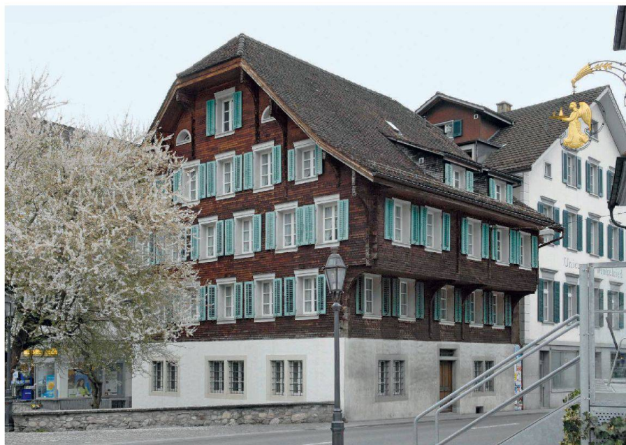
Stans, Sigristenhaus, Dorfplatz 13, année de construction 1691. Vue depuis le sud-est