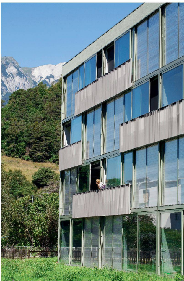
Logements pour personnes âgées à Domat/Ems (bureau d'architecture Dietrich Schwarz). Les grandes fenêtres côté sud constituent le cœur de l'approvisionnement en chaleur. Des capteurs solaires d'une surface de 22,5 m 2 et deux pompes à chaleur air/eau fournissent le solde de calories. Ce bâtiment innovatif a reçu le Prix solaire 2006

Cependant, alors que la population de la Suisse reste presque constante, sa surface construite ne cesse de grandir. Si ses habitants sont plus nombreux à posséder des logements de plus en plus grands (la surface moyenne par habitant a augmenté de 39 m 2 en 1990 à 44 m 2 en 2000), c'est surtout la surface construite non résidentielle (industrie, bureaux, commerces) qui est en nette croissance. Ce parc immobilier grandissant, vieillissant aussi, et souvent chauffé au mazout, est le principal consommateur des importations suisses en ressources fossiles (environ deux tiers). De plus, la demande croissante en électricité nécessaire pour l'utilisation d'un nombre grandissant d'appareils électriques (certes plus efficaces mais en plus