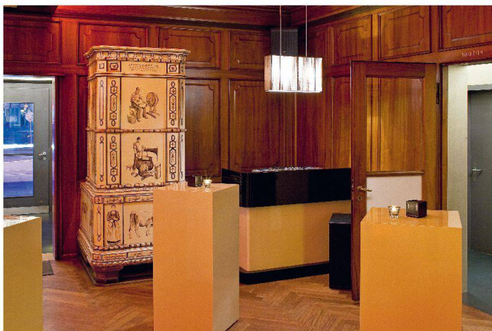
DJ-Pult neben elektrischem Kachelofen: Die Barbetreiber erhalten freiwillig möglichst viel vom Interieur.