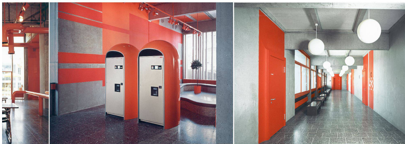
Das Architektenpaar Rudolf und Esther Guyer prägte die Baukultur der 60er- und 70er-Jahre im Raume Zürich entscheidend mit. Die Vorliebe galt dem Beton als Bau- und Gestaltungsmaterial. Die Architekten entwickelten ein neues Vorfabrikationssystem aus räumlichen Schwerbetonelementen – nicht aus Platten –, das eine skulptural gegliederte Architektur kostengünstig ermöglichte. In der ehem. Gewerbeschule wendeten sie dieses System an, mit eingefärbtem, sandgestrahltem Sichtbeton, auch im Gebäudeinnern in durchgehend identischer Ausführung. Schulmöbel, Vitrinen und Schulwandbrunnen wurden speziell entworfen und aus farbigem Kunststoff gegossen.

auch technikgeschichtliche Fragen sind von Belang. Die Planer jener Architekturen waren begeistert von Ideen einer Rationalisierung der Bauprozesse – alle Arten von Strategien zur Optimierung wurden hoffnungsvoll (weiter-)entwickelt und in Ansätzen auch umgesetzt.