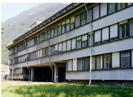
Verwaltungsgebäude Eternit AG in Niederurnen