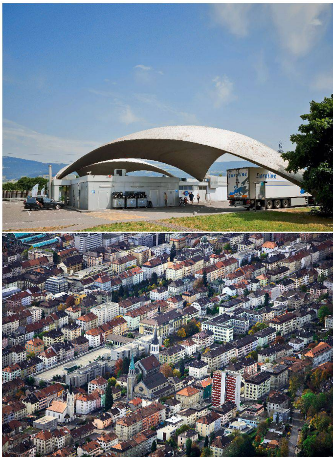
Die Kuppeldächer der Autobahnraststätte Deitingen-Süd blieben erhalten. Die Denkmalpflege stellte die sogenannten Isler-Schalen 1999 unter Schutz.