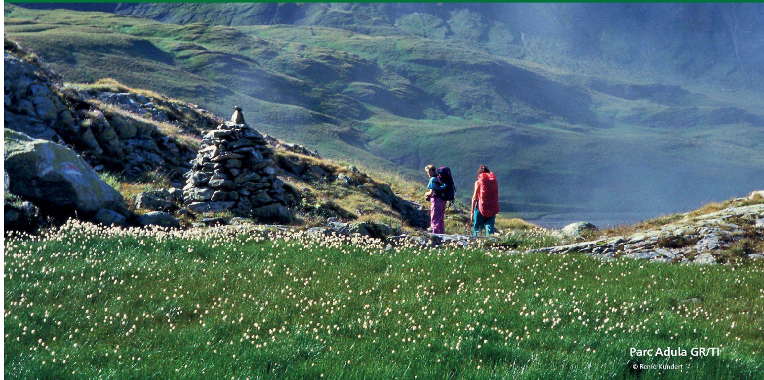
Parc Adula GR/TI