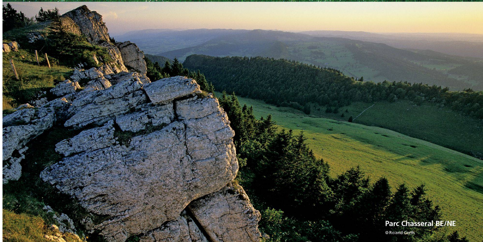
Parc Chasseral BE/NE