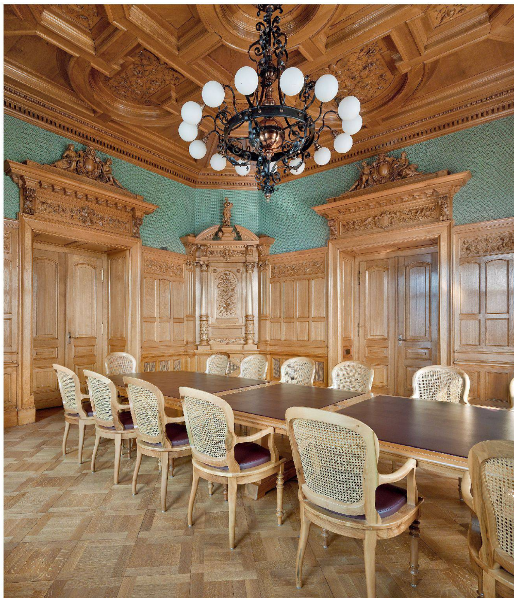
La salle dite de Brienzer a été présentée dans le cadre de l'Exposition universelle de Paris de 1900 avant d'être intégrée au Palais fédéral. Un papier peint reconstitué dans la gamme de teintes retenue rééquilibre l'espace.