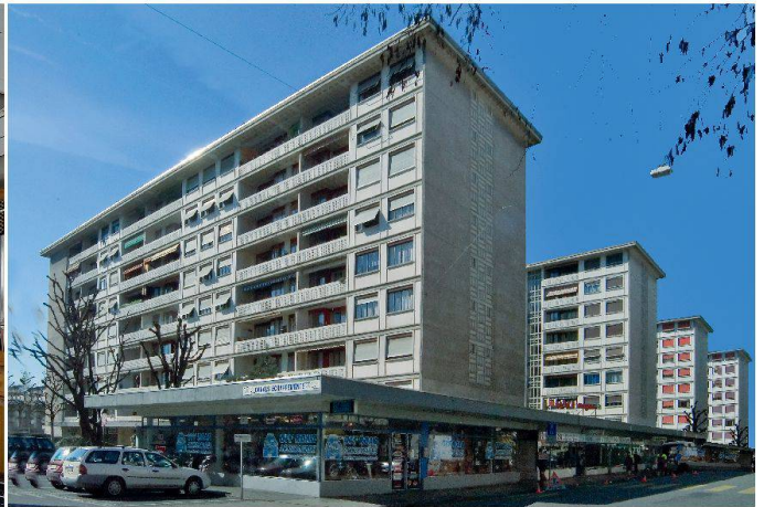
Eglise néo-apostolique, 1949–1950, architectes Werner Max Moser, en collaboration avec Max Ernst Haefeli et Rudolf Steiger, réalisation par Francis Quétant (à gauche). Cité Carl-Vogt, construction 1961–1964, architectes et ingénieurs Honegger Frères (à droite).