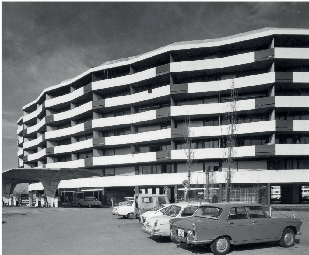
SI Surpraille, construction 1962–1964, architecte Arthur Bugna.