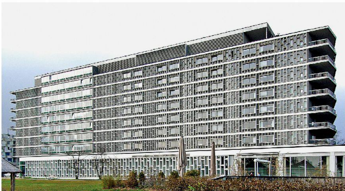
Das Felix Platter-Spital (1961–1967) wird im neuen Faltblatt «Baukultur entdecken» vorgestellt.

Uta Hassler, Catherine Dumont d'Ayot (Hg.), Bauten der Boomjahre – Paradoxien der Erhaltung. Tagungsband des Instituts für Denkmalpflege und Bauforschung (IDB) der ETH Zürich, zweisprachig (Deutsch/Französisch). CHF 59.–, 360 Seiten. 2009, Infolio éditions, Gollion. ISBN 9-782-884-741811