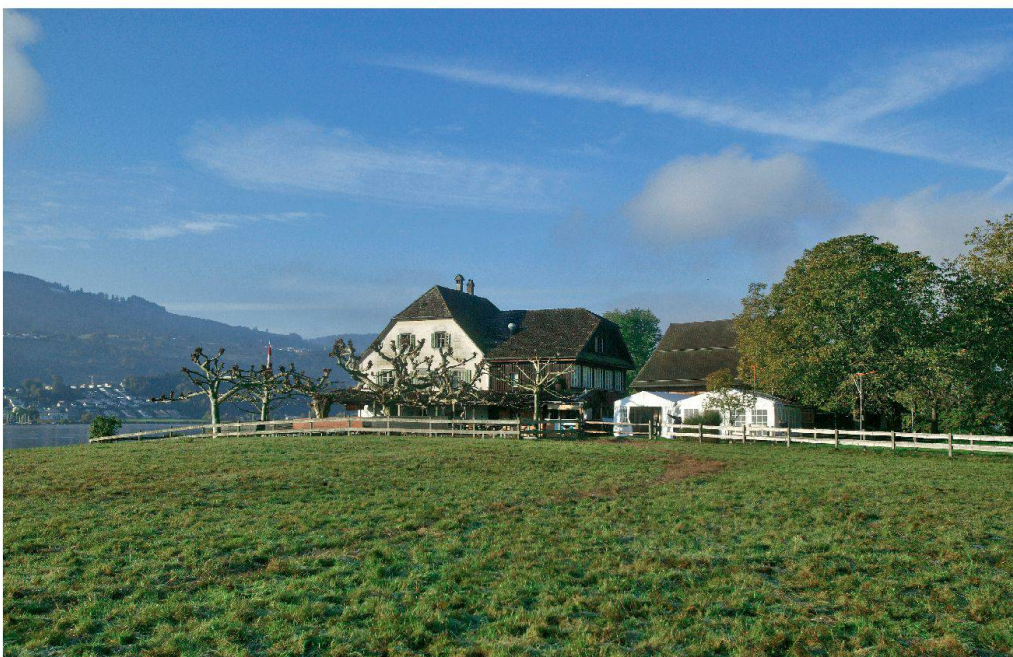
Die Insel Ufnau, wie sie sich heute präsentiert. (Bild Atelier Peter Zumthor & Partner)

Aufgrund der starken Opposition kamen dem Kanton Schwyz als Bewilligungsinstanz Zweifel an der Gesetzeskonformität des Projektes. Er forderte ein Gutachten der Eidgenössischen Kommission für Natur- und Heimatschutz (ENHK) an. Dieses gab dem damals überdimensionierten Projekt den Todesstoss. Abt Martin vom Kloster Einsiedeln musste über die Bücher. Er setzte eine Arbeitsgruppe ein, in