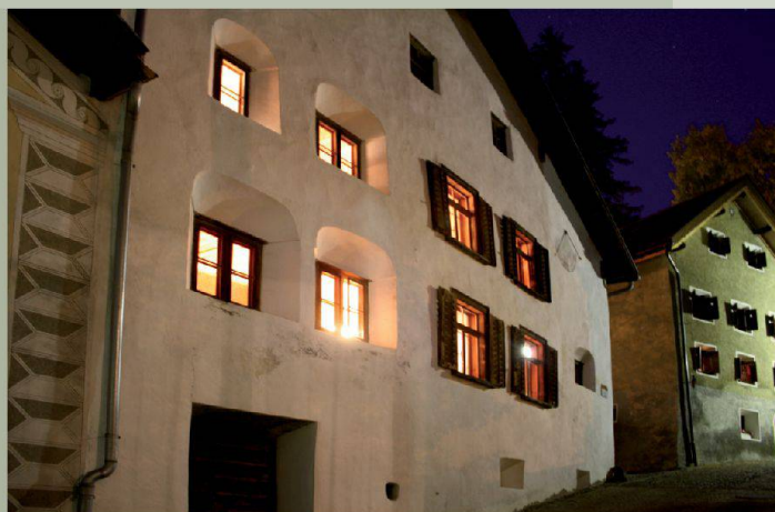
Engadinerhaus — Scuol (GR)

Découvrez d'autres maisons hors du commun sur www.magnificasa.ch .