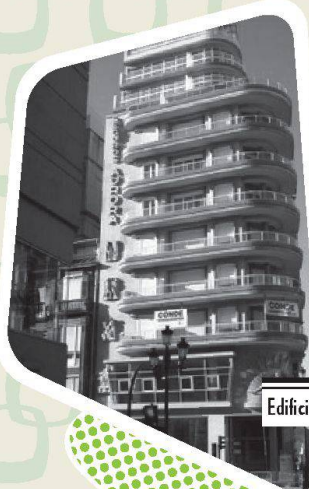
Edificio Aurora Polar, 1959, Vigo (Galizien)

Ich freute mich sehr, als Spanien mit «la, la, la» 1968 den Eurovision Song Contest gewann. Ich liebe dieses Lied und singe es heute immer noch. Das Kleid, welches die junge Sängerin Massiel trug, wurde die neue Mode. Als Schneiderin entwarf ich ein sehr ähnliches Kleid welches ich noch heute bei mir im Schrank neben meinem Hochzeitskleid aufbewahre.