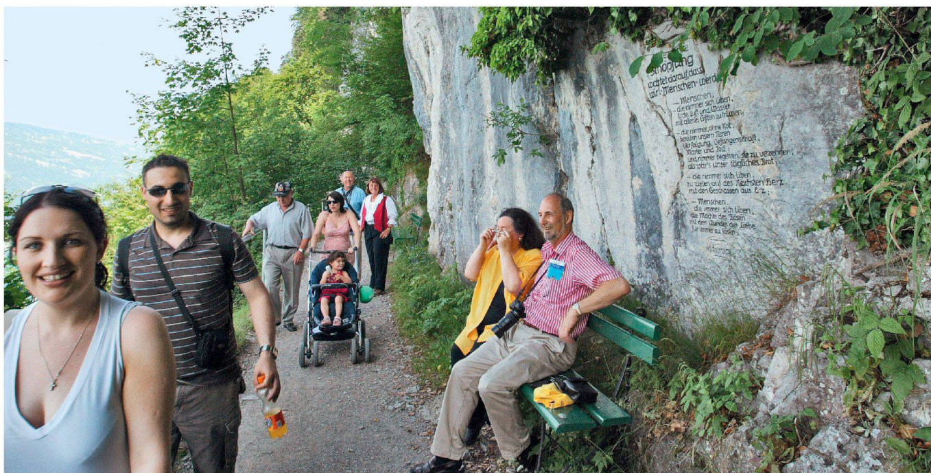
Der über 110-jährige Felsenweg am Bürgenstock gehört mit zu den «schönsten Spaziergängen der Schweiz».

Das 76-seitige Büchlein (deutsch/französisch) mit vielen farbigen Abbildungen ist unter www.heimatschutz.ch/shop zu bestellen und kostet CHF 16.– (für Heimatschutz-Mitglieder CHF 8.–).