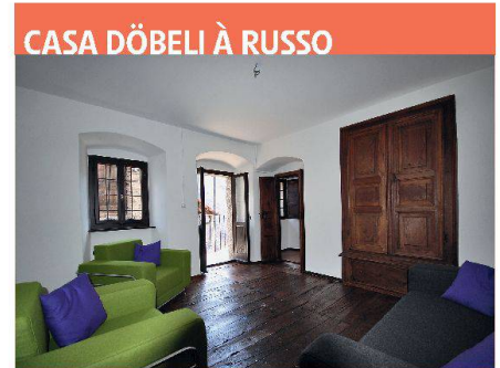
La Casa Döbeli peu avant son inauguration du 21 avril 2010.

La Casa Döbeli est une maison bourgeoise sobre du XVIII e siècle au centre du village de Russo dans le Val Onsernone. Elle faisait partie d'un legs à la section tessinoise de Patrimoine suisse et a été confiée en droit de superficie à la Fondation «Vacances au cœur du patrimoine». Le dernier propriétaire, monsieur Döbeli, un original et un philosophe, avait pratiquement laissé la maison dans son état original. Ce qui offrait une opportunité de rénover la maison en douceur puis de la proposer comme maison historique pour des «Vacances au cœur du patrimoine». Un bain moderne a été aménagé au rez-de-chaussée, une cuisine à l'étage. Quelques structures en bois des années 70 ont été éliminées. Les sols, plafonds, parois et fenêtres ont été nettoyés et repeints. Cette maison étroite en pierres respire une élégance simple. Dans ses longues suites de chambres, le blanc des parois contraste avec le bois sombre des armoires encastrées. L'ameublement, neuf, est contemporain. La maison a été inaugurée le 21 avril 2010 avec une petite fête. Depuis mi-mai, six à huit hôtes peuvent goûter ici au charme méridional de cette maison historique au cœur des montagnes tessinoises. La Casa Döbeli est la deuxième maison en main propre de la fondation proposée à la location. La Fondation «Vacances au cœur du Patrimoine» a été créée en 2005 par Patrimoine suisse. A part ses deux propres maisons, la fondation propose dix autres objets en mains de tiers mais loués par ses soins.