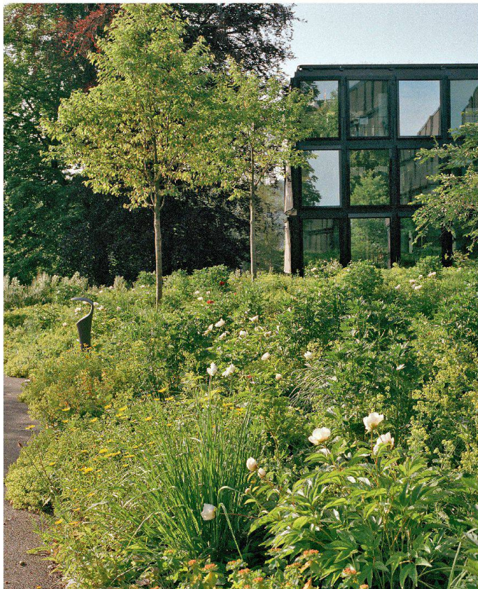
«Blumenberge» à Saint-Gall.

Pour en savoir plus: www.patrimoinessuisse.ch