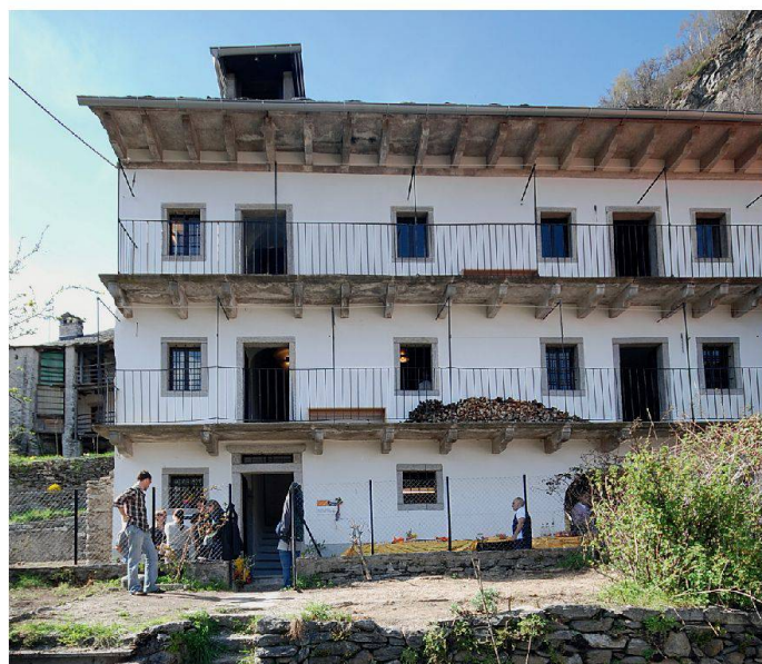
Die Casa Döbeli kurz vor der Einweihungsfeier vom 21. April 2010.

Weitere Informationen unter www.magnificasa.ch