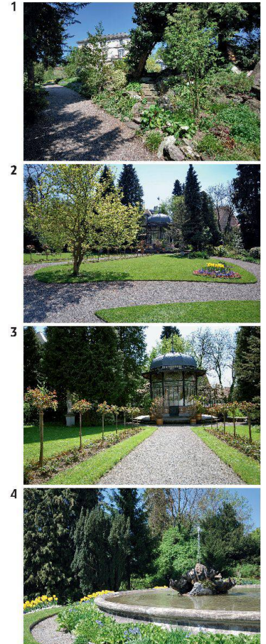
1: Weg am Alpengarten vorbei zur Villa