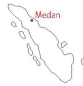
Die Insel Sumatra mit der Ortschaft Medan