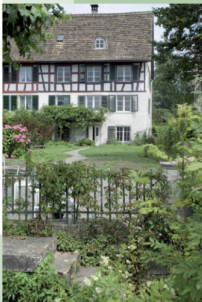
Haus Blumenhalde — Uerikon (ZH)