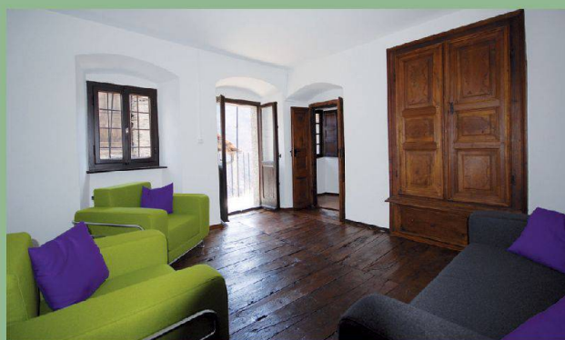
Casa Döbeli — Russo (TI)

Unter www.magnificasa.ch finden Sie weitere aussergewöhnliche Häuser.