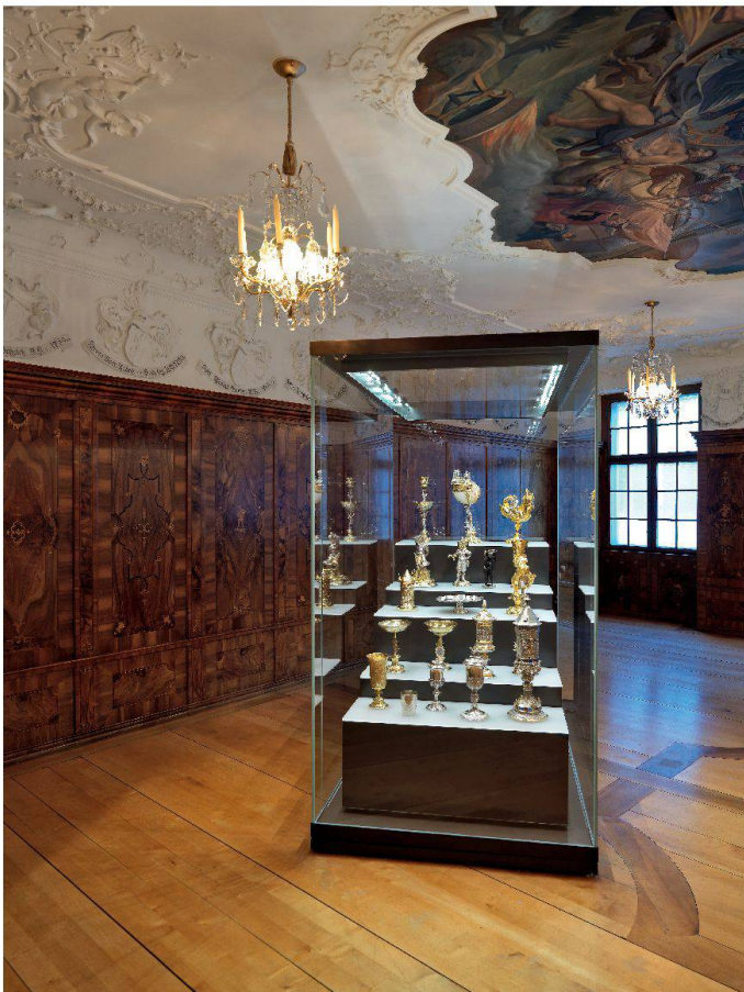
Museum zu Allerheiligen, Schaffhausen: Festsaal aus dem Zunfthaus der Gerber von 1734 mit der neuen Präsentation des Schaffhauser Zunftsilbers.

Historismus und auch angesichts der allmählichen Verbreitung des Ausstellungswesens der Darstellung, ja sogar der Zelebrierung des Wohnens eine zunehmende Bedeutung beimass. Um die Mitte des 19. Jahrhunderts entstanden dann in Europa die ersten Kunstgewerbemuseen und die historischen Museen. Diese räumten der Ausstellung von Alltagsgegenständen und der Darstellung des täglichen Lebens einen hohen Stellenwert ein, dies ganz im Gegensatz zu den traditionellen Kunstmuseen mit ihrem Geniekult. Es wurde eine wichtige Museumsaufgabe, dem Besucher zu zeigen, wie man in früheren Epochen gelebt hatte, und die Präsentation von Wohnräumen wurde ein beliebtes museographisches Konzept. Freilich drängen sich aus heutiger Sicht wichtige Einschränkungen bezüglich der Authentizität solcher «Period Rooms» auf: In Ermangelung von Objekten aus dem Besitz der ärmeren Bevölkerungsschichten konnten die Museen meist nur die Lebensformen der «upper class» präsentieren; und zwecks Darstellung möglichst eingängiger Wohn- und Stilkonzepte griffen die Museumsverantwortlichen mitunter in die Trickkiste der Szenographen und arrangierten mithilfe von Kopien und Stilvermischungen auch fragwürdigere Raumentsembles, welche mit effektiv historischen Befunden nur noch wenig zu tun hatten. Entsprechend genossen solche «Historische Zimmer» in den Museen nicht immer den besten Ruf als wahrheitsgetreues Ausstellungsgut und als schlüssiges Vermittlungskonzept.