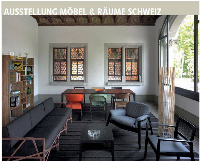
Stube mit zeitgenössischen Möbeln von Schweizer Herstellern und Designern.

Stukkaturen handeln), um sie vor der unsachgemässen Behandlung, vor der Zerstörung oder vor dem Verkauf ins Ausland zu retten. Gerade zur Blütezeit der «Period Rooms» in den Museen, nämlich in den Jahrzehnten vor und nach 1900, waren viele historische Raumausstattungen durch die bauliche Hochkonjunktur und die damit verbundene Zerstörungswut der Gründerzeit akut gefährdet. Die Funktionsweise der Museen als Arche bestätigt sich auch in der heutigen Periode, da vereinzelte «Period Rooms» aus den Museen an ihre angestammten Orte in historischen Gebäuden rücküberführt werden können.