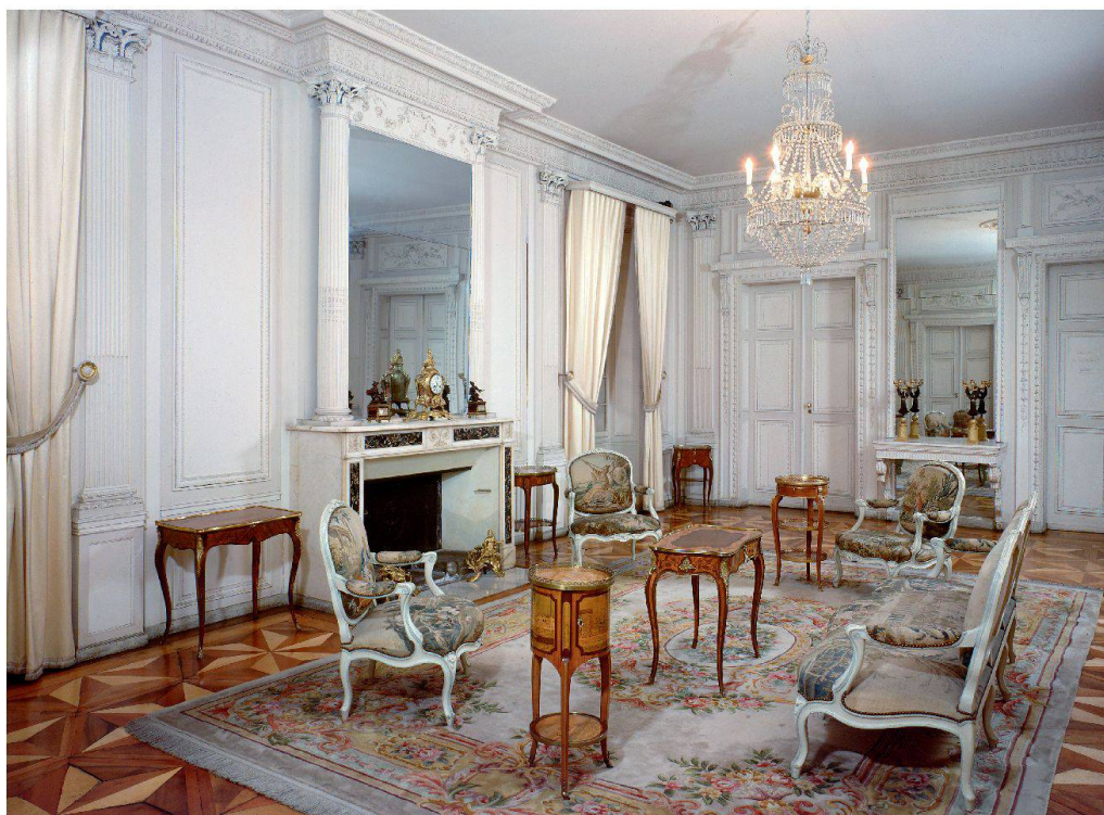
Musée d'art et d'histoire, Genève: salon du château de Cartigny avec boiseries de la fin du XVIII e siècle de Jean Jaquet.

ont pris une grande importance, contrastant avec le culte du génie des époques précédentes. L'objectif de ces musées était de montrer aux visiteurs comment les gens vivaient dans les époques antérieures. Les «period rooms» étaient un concept muséographique apprécié. Aujourd'hui, des doutes sont émis quant à l'authenticité de ces salles historiques qui parfois présentaient surtout des objets de la vie quotidienne de la classe aisée et avaient été arrangés dans des ensembles reconstitués et pas toujours de la plus grande authenticité. Néanmoins, les «period rooms» sont des concepts d'exposition utilisés par de nombreux musées en Europe et en Amérique du Nord. La Suisse peut se prévaloir d'une densité inégalée de musées présentant des séries entières de