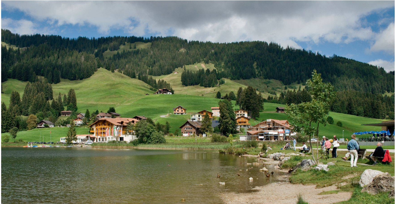
Schwarzsee FR – Bild aus der Reihe «Paysages occupés» von Yves André (vgl. S. 18 in diesem Heft). (Bild Yves André)