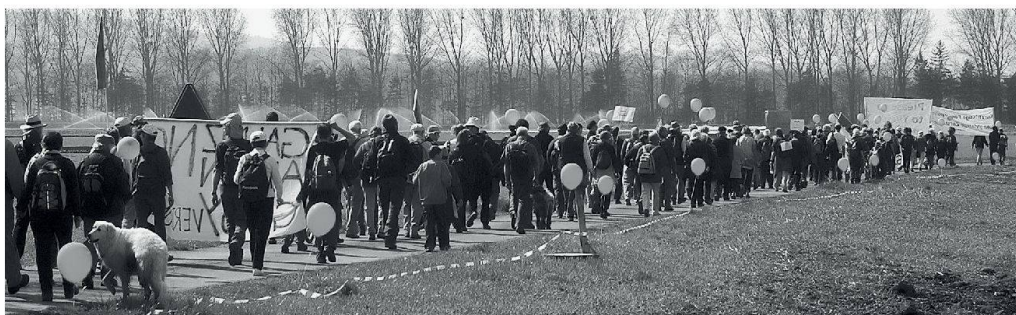
La volonté du Conseil d'Etat fribourgeois de classer en zone à bâtir les 55 ha du Grand Marais agricole de Galmiz avait déclenché une vague de protestations.

Les principaux défis que l'aménagement du territoire doit à l'avenir relever sont la croissance démographique, en particulier la demande disproportionnée de surface habitable par habitant, et le surdimensionnement des zones à bâtir. Selon des études de la Confédération, les réserves de zones à bâtir en Suisse dépassent de trois, voire quatre fois la demande prévisible jusqu'en 2030! L'excédent représente 10 000 à 25 000 ha selon que les réserves sont exploitées dans le milieu bâti ou en dehors de celui-ci. Le gel de la surface des zones à bâtir durant 20 ans, préconisé par l'initiative pour le paysage, ne peut donc en aucun cas être quali-