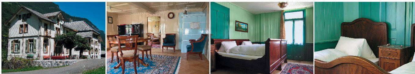
Hotel «Alpenhof» in Weisstannen: Die alte Substanz wird gestärkt, die Zimmer werden so belassen, wie sie sind.

L'Hôtel Alpenhof de Weisstannen: les éléments historiques seront mis en valeur, et les chambres seront laissées telles quelles.