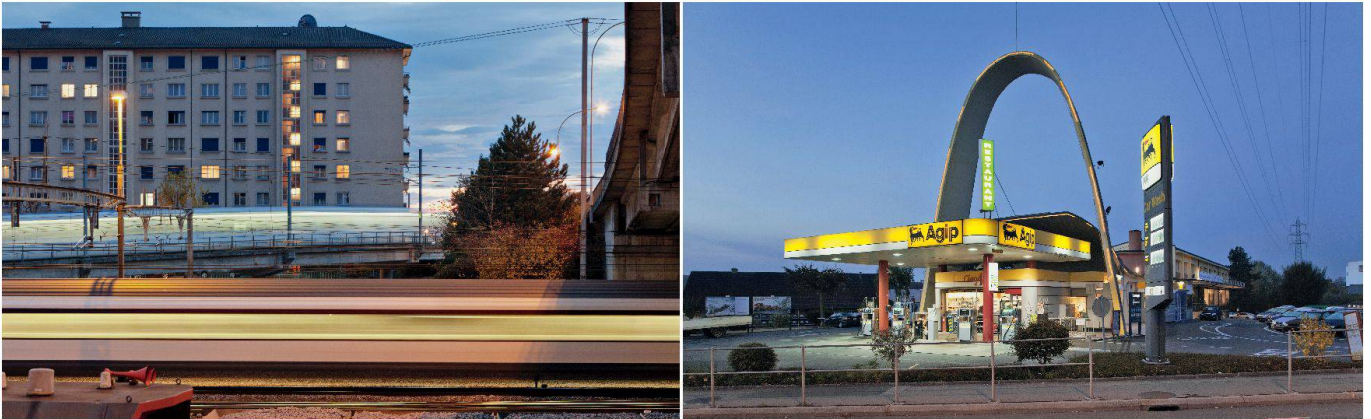
Die Gemeinden des Ouest lausannois werden beherrscht von Verkehrsachsen, Eisenbahnknoten, Einkaufszentren und Brachen.

Les communes de l'Ouest lausannois sont dominées par des axes de circulation, des nœuds ferroviaires, des hypermarchés et des friches.