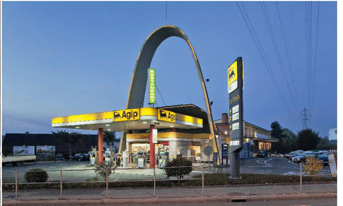
Die Gemeinden des Ouest lausannois werden beherrscht von Verkehrsachsen, Eisenbahnknoten, Einkaufszentren und Brachen.

Les communes de l'Ouest lausannois sont dominées par des axes de circulation, des nœuds ferroviaires, des hypermarchés et des friches.