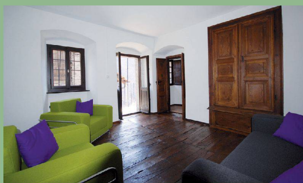
Casa Döbeli — Russo (TI)

Unter www.magnificasa.ch finden Sie weitere aussergewöhnliche Häuser.