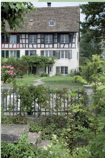
Haus Blumenhalde — Uerikon (ZH)