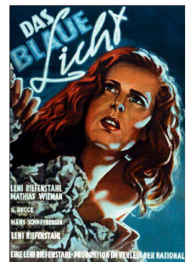
Foroglio est célèbre dans toute l'Europe pour sa magnifique cascade de 100 m de hauteur dévalant du Val Calnegia. Cette chute d'eau imposante servit de décor au film «La lumière bleue» (1931) de la réalisatrice allemande Leni Riefenstahl.

ren – von 1965 bis 1970 – wurden durch einen kaum vorstellbaren, einschneidenden Vorgang im Valle Bavona drei grosse Staudämme, drei in den Fels gehauene Kraftwerke und kilometerlange, unsichtbare Stollen durch die Berge erschaffen. Welche Opfer dies für die Landschaft und für die Bevölkerung bedeutete, ist an den Wasserläufen zu beobachten, die sich über lange Strecken nur noch als Rinnsale zeigen, die sich in den breiten, ausgetrockneten Flussbetten zwischen Felsblöcken verlieren. Auf das abrupte Ende einer längst vergangenen