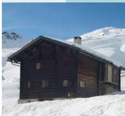
Nüw Hus — Safiental (GR)