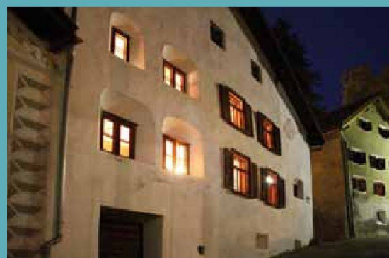
Engadinerhaus — Scuol (GR)

Découvrez d'autres maisons hors du commun sur www.magnificasa.ch .