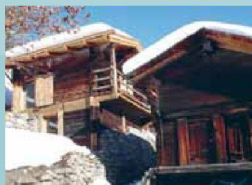
Stallscheune — Niederwald (VS)