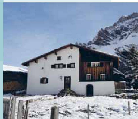
Unteres Turrahus — Safiental (GR)

Unter www.magnificasa.ch finden Sie weitere aussergewöhnliche Häuser.