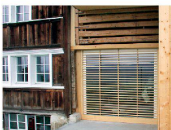
Gais AR, Luser. Im Raum zwischen Wohn- und Stallteil ist eine grosse Öffnung in der Aussenwand möglich.