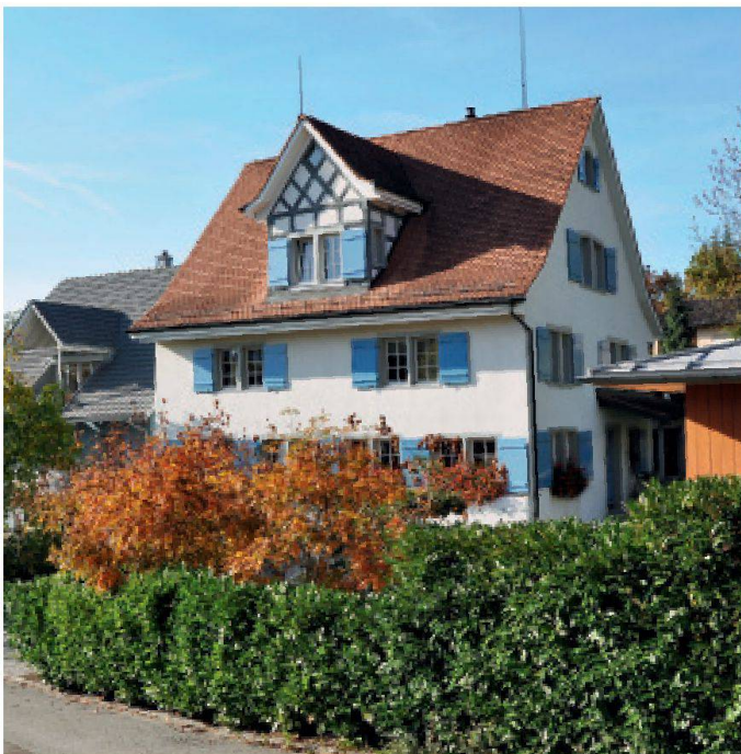
Männedorf: la ferme transformée où Max Frisch écrivit le roman Homo Faber.