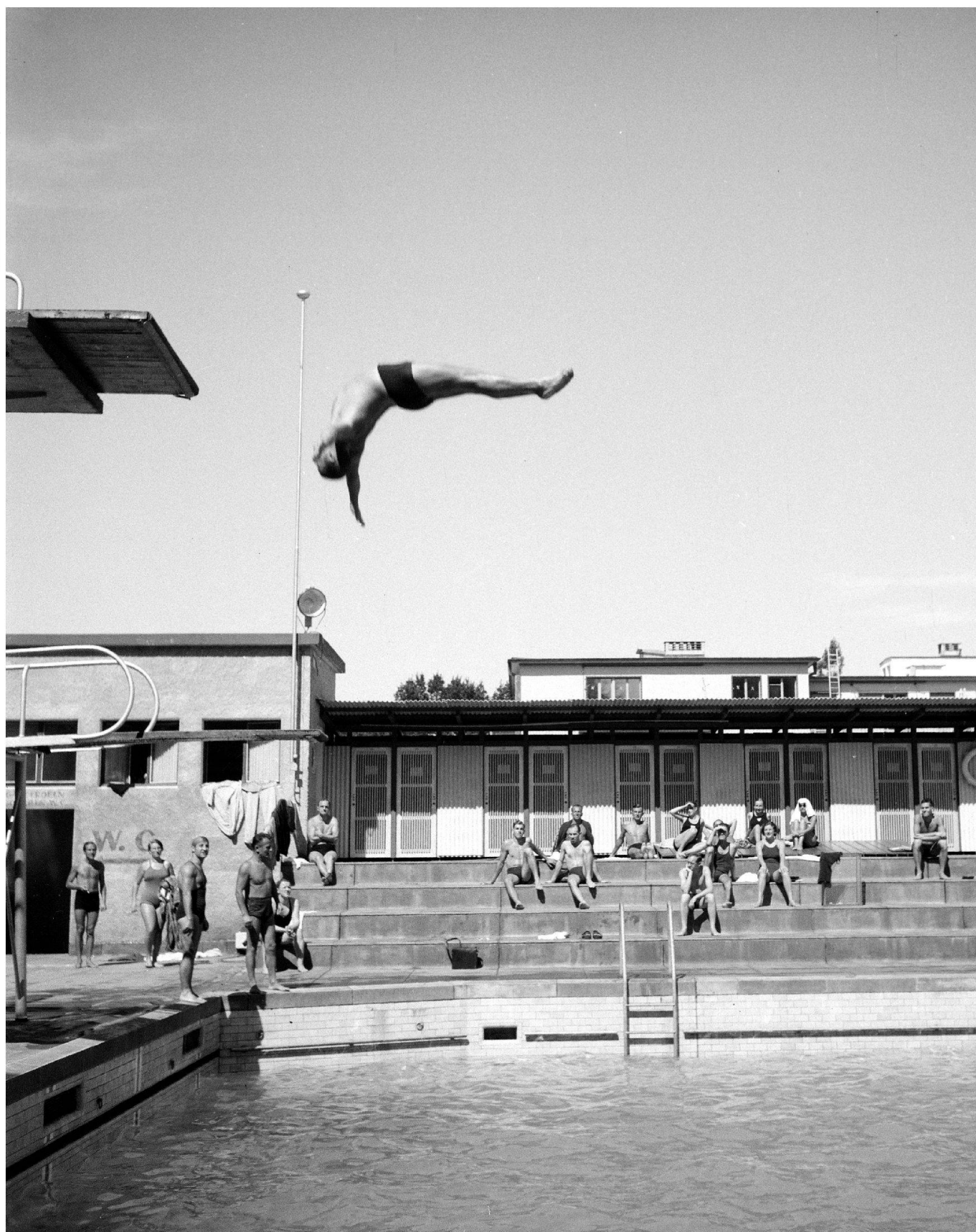
Plongeur de haut-vol à la piscine Ka-We-De vers 1945