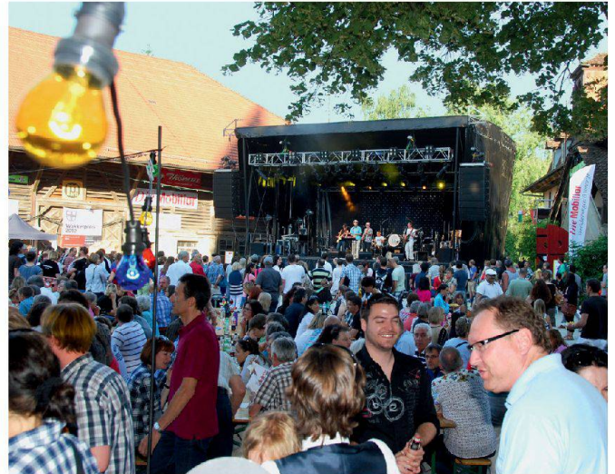
Le groupe Adam Had'am sur la scène en plein air de la cour du château de Köniz

haben sich gelohnt. Köniz hat sich unglaublich verändert – und hat es trotzdem geschafft, seinen Charakter weitgehend zu erhalten. Die städtisch geprägten Ortsteile wie zum Beispiel Köniz-Zentrum oder das Liebefeld wurden stark verdichtet und damit noch städtischer. Die ländlichen Ortsteile wie Herzwil oder das Gurten-dorf hat man vor planlosen Überbauungen verschont.