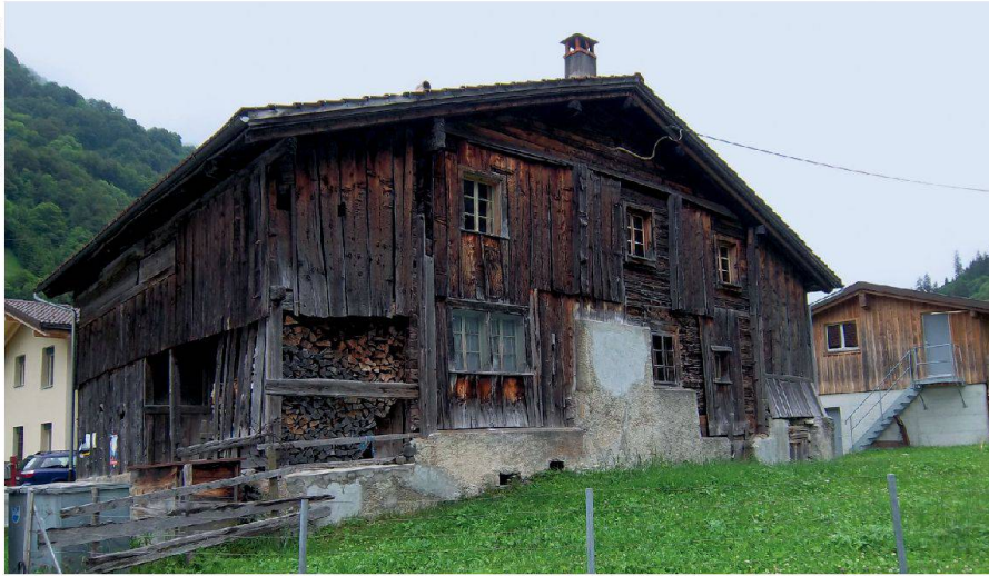
Stüssihofstatt, Unterschächen (UR)