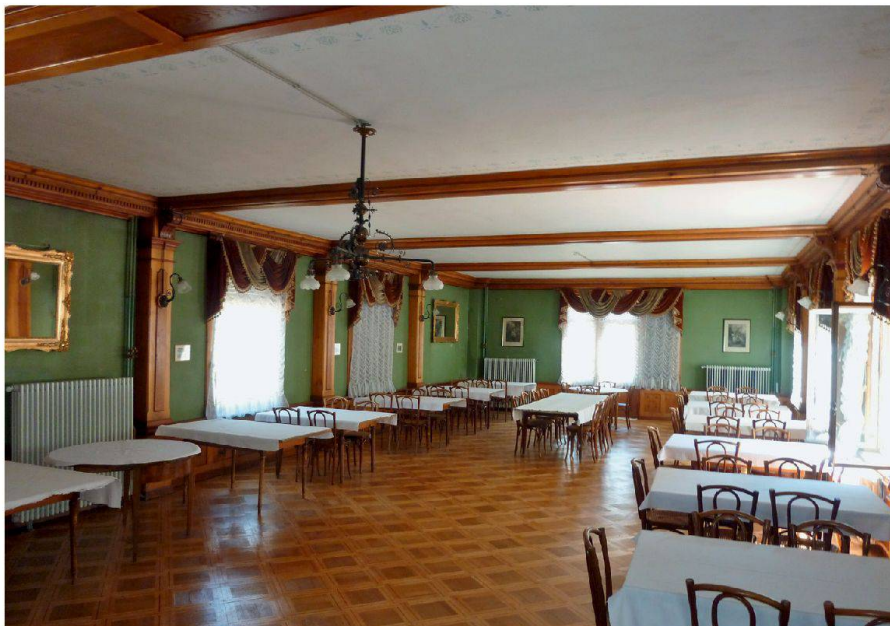
Der Jugendstilsaal im Posthotel Löwen in Mulegns GR