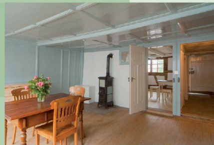
Fischerhäuser — Romanshorn (TG)