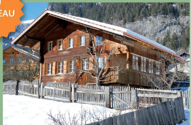
Haus auf der Kreuzgasse — Boltigen (BE)

Découvrez d'autres maisons hors du commun sur www.magnificasa.ch .