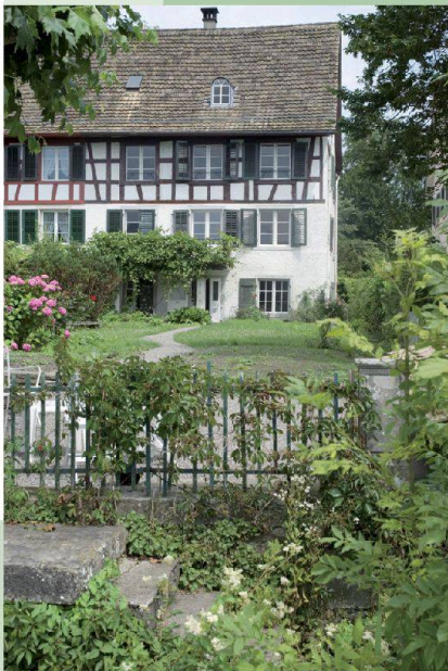
Haus Blumenhalde — Uerikon (ZH)