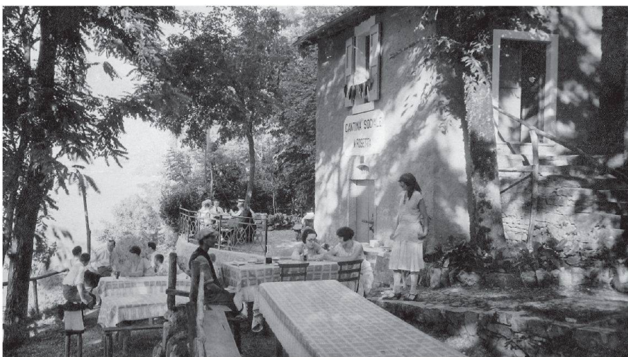
Associazione Viva Grandi

Die 21. Europäischen Tage des Denkmals finden am 13. und 14. September 2014 statt. Sie bitten diesmal «zu Tisch». Der Tisch und die mit ihm verbundenen Gegenstände wie Geschirr und Lebensmittel, Orte wie Restaurants und Küchen und Tätigkeiten wie Essen und Kochen sind stets zentraler Teil des menschlichen Lebens und an diesem Wochenende Mittelpunkt eines reichen Programms in allen Schweizer Regionen. Entdecken Sie etwa mit Ihren Kindern die Obst- und Gemüsemalereien im Heimat-