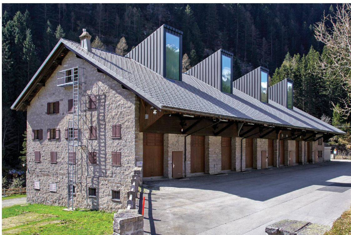
Das vom Büro Burkhalter Sumi Architekten umgebaute ehemalige Zeughaus in Göschenen