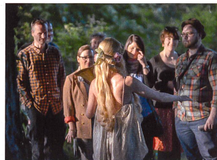
Mass & Fieber

Bei Fragen: Tel. 044 254 57 90 (Mo–Fr 14–17h)