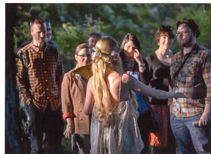
Mass & Fieber

Bei Fragen: Tel. 044 254 57 90 (Mo–Fr 14–17h)