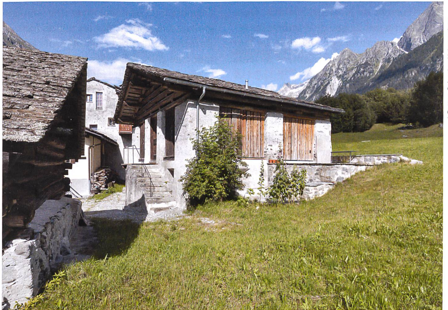
J. Batten, Schweizer Heimatschutz

Réaffecter judicieusement les bâtiments agricoles: Au cœur du village de Stampa, une étable a été transformée en habitation de manière subtile. La topographie des abords est restée en l'état. Architecte: André Born, 2012.