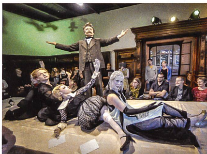
Bespielung der Villa Rosenthal in Jena (D), Mass & Fieber, 2013