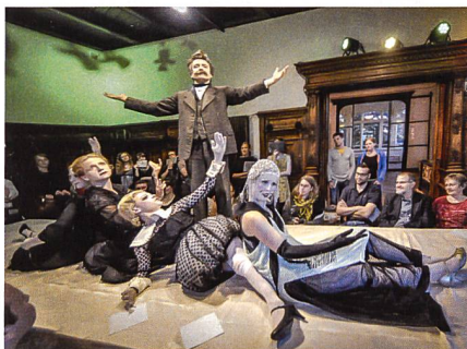
Bespielung der Villa Rosenthal in Jena (D), Mass & Fieber, 2013