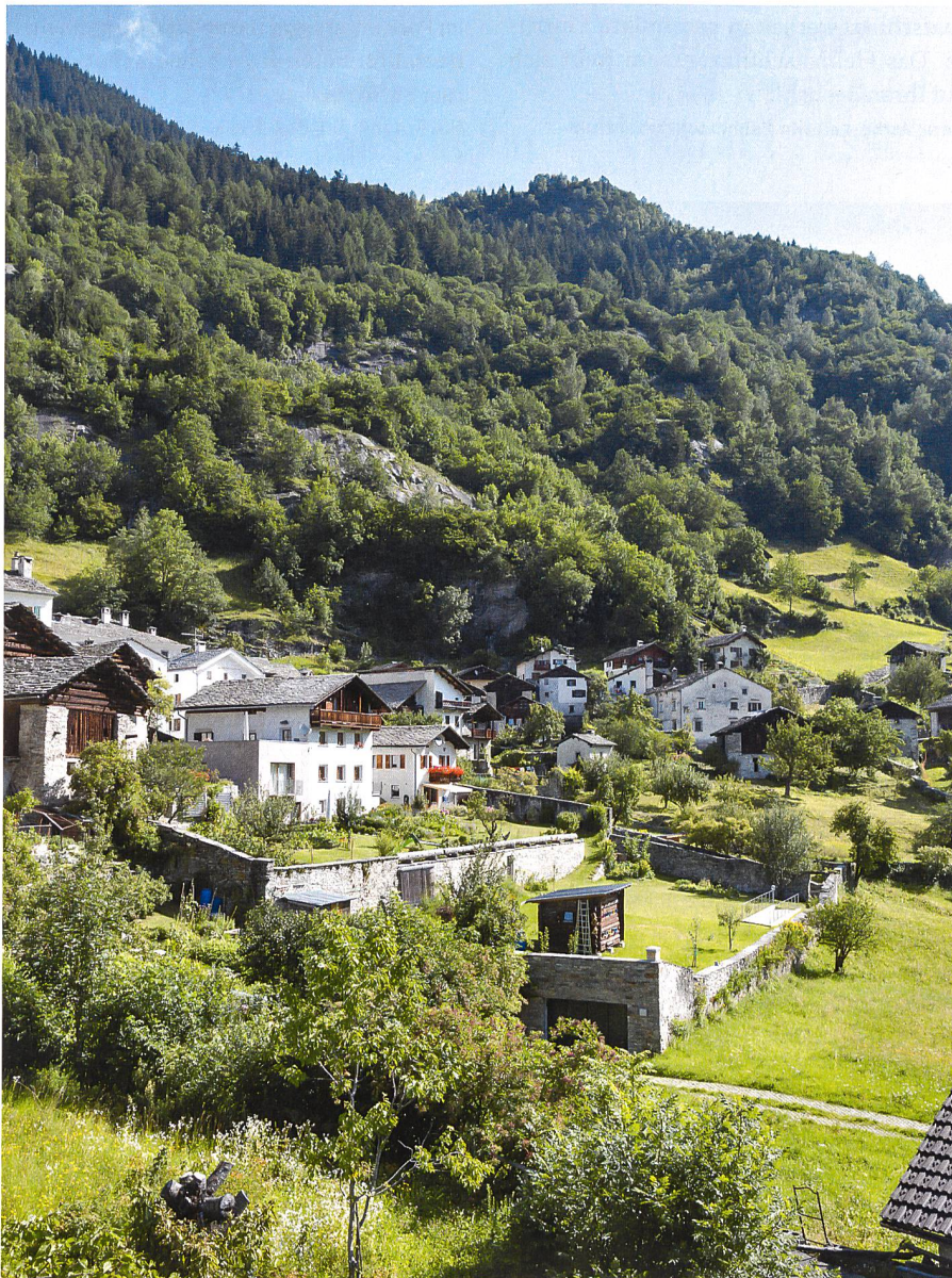
J. Batten, Patrimoine suisse

Neubau unter dem Nutzgarten: Die Gemeinde unterstützte die Realisierung von zwölf privaten Autoabstellplätzen in Soglio, um einen Teil der provisorischen Parkplätze im Dorfkern beheben zu können. Der ursprüngliche Nutzgarten wurde über dem Garagendach wieder hergestellt. Ingenieur: Martin Gini, 2011