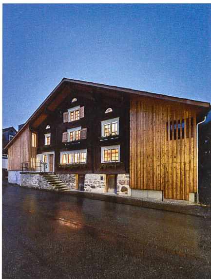
Das 1755 erbaute Schindelhaus in Oberterzen SG La Schindelhaus de 1755 à Oberterzen (SG)