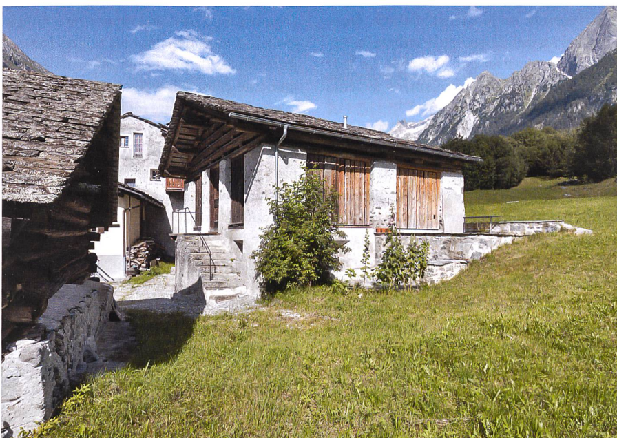
J. Batten, Schweizer Heimatschutz

Réaffecter judicieusement les bâtiments agricoles: Au cœur du village de Stampa, une étable a été transformée en habitation de manière subtile. La topographie des abords est restée en l'état. Architecte: André Born, 2012.