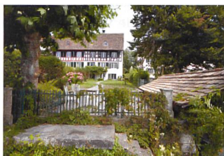
Haus Blumenhalde Uerikon, 2009

fiental GR wurde von der Stiftung Walserhaus Safiental gekauft, sorgfältig renoviert und wird nun über die Stiftung Ferien im Baudenkmal vermietet. Im Dezember kann das dritte Objekt in die Angebotspalette aufgenommen werden. Dank der Initiative einer Privatperson wird das Gon Hüs in Niederwald VS aus dem Jahre 1558 nun wieder bewohnt, nachdem es 200 Jahre lang teilweise leer stand und sich in kritischem Zustand befand.