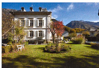
Weisse Villa Mitlödi, 2012–2014

L'édition 2/2004 de la revue Heimatschutz/Patrimoine présente le projet Vacances au cœur du patrimoine comme un projet concret pour la célébration, l'année suivante, du 100 e anniversaire de Patrimoine suisse. Une aide financière allouée pour l'encouragement de l'innovation touristique (Innotour) permet de progresser et de poser les premiers jalons du projet.