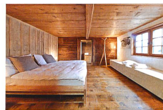
Schindelhaus Oberterzen, 2015

Magnifique exemple de maison engadinoise du XIV e siècle dont l'authenticité a pu être préservée, la Chesa Sulai, située au cœur du village de S-chanf (GR), complète dès le mois de janvier l'offre de locations. Les travaux de rénovation de la Stüssihofstatt, à Unterschächen (UR), une maison en bois de deux étages datant de 1450, se terminent en juin. Le chalet Ofenhausstöckli, de Zimmerwald (BE), et la Belwalder-Gitsch Hüs, à Grenchols (VS), peuvent accueillir des vacanciers dès le mois de septembre. La Türalihus, de Valendas (GR), qui reçoit le lièvre de bronze 2014 décerné par la revue Hochparterre , est inaugurée en septembre. En octobre, un ancien grenier à blé (Spycher), situé à Niederwald (VS), est intégré au catalogue de locations.