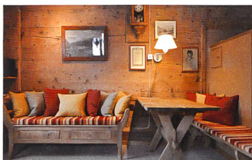
Chesa Sulai S-chanf, 2014

L'offre de locations s'enrichit de plusieurs objets: une maison en pierre, à Brusio (GR), entièrement rénovée en collaboration avec la conservation du patrimoine, une grange réaffectée à Beatenberg (BE) et la Blumenhalde, dans le village d'Uerikon (ZH), une maison à colombages du XVIII e siècle appartenant à la Ritterhaus-Vereinigung d'Uerikon. Dès le mois d'octobre, deux autres logements de vacances sont mis en location dans une maison engadinoise à Scuol (GR) et à partir du mois de décembre, deux autres objets à Niederwald (VS).