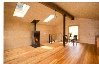
Scheune Beatenberg, 2009