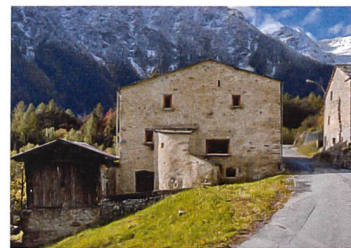
Steinhaus Brusio, 2009