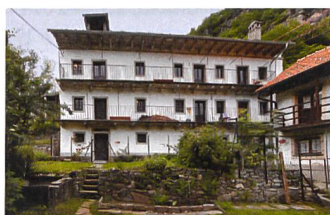
Casa Döbeli Russo, 2010

Ab Februar kann das Untere Turrachus im Safiental GR, ein Walserhaus der besonderen Art, gemietet werden. Im Juli kommen drei Wohnungen in den Fischerhäusern in Romanshorn TG dazu. Damit kann für diese lange Zeit leer stehenden Häuser eine gute Lösung realisiert werden. Ein Höhepunkt ist die Eröffnung des Hauses auf der Kreuzgasse in Boltigen BE. Das regionaltypische Kleinbauernhaus aus dem 16. Jahrhundert wurde in Zusammenarbeit mit der Denkmalpflege umfassend saniert.