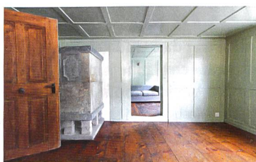
Stüssihofstatt Unterschächen, 2014

La fondation Vacances au cœur du patrimoine propose déjà douze logements de vacances dans dix maisons historiques. Le catalogue s'enrichit avec l'ajout du premier objet tessinois: la Casa Döbeli, située à Russo (TI). Fait remarquable, Vacances au cœur du patrimoine est nommée au Milestone 2010. Ce prix placé sous l'égide de la Fédération suisse du tourisme est décerné chaque année par htr-Hotelrevue et Hôtellerie suisse, avec le soutien du SECO. Il distingue des prestations exceptionnelles dans le cadre de l'innovation touristique en Suisse.