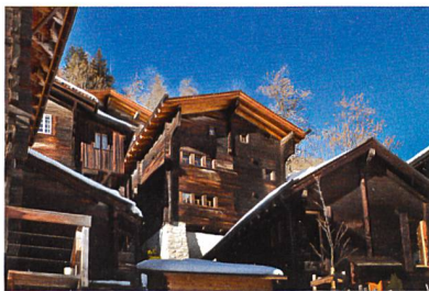
Gon Hüs Niederwald, 2009