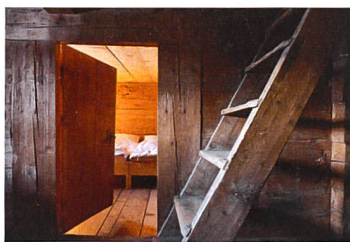
Nüw Hus Safiental, 2008

vorgelegt. Dank einem Beitrag aus dem Förderkredit für die Angebotserneuerung im Tourismus (Innotour) können die Vorarbeiten für das Projekt vorangetrieben werden.