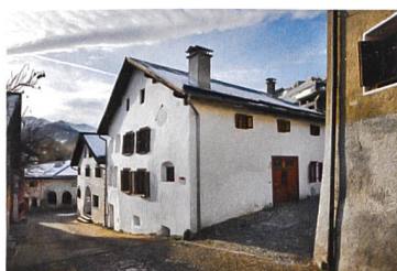
Engadinerhaus Scuol, 2009

Neu ins Angebot kommen ein Steinhaus in Brusio GR, das in Zusammenarbeit mit der Denkmalpflege vollständig renoviert werden konnte, eine umgenutzte Scheune in Beatenberg BE und das Haus Blumenhalde in Uerikon ZH, ein Riegelhaus aus dem 18. Jahrhundert, das der Ritterhaus-Vereinigung in Uerikon gehört. Weiter stehen in einem Engadinerhaus in Scuol GR ab Oktober zwei Ferienwohnungen zur Verfügung, und auch in Niederwald werden ab Dezember zwei zusätzliche Objekte vermietet.