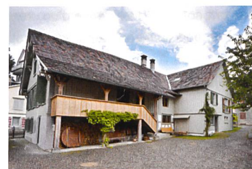
Fischerhäuser Romanshorn, 2011

Im Schindelhaus in Obererzen SG kann ab Januar erlebt werden, wie harmonisch sich moderner Wohnkomfort mit historischer Baubsubstanz verknüpfen lässt. Die Ciäsa Picenoni Cief empfängt ab März in Bondo GR, in der frisch gekürten Wakkerpreisgemeinde Bergell, Feriengäste aus nah und fern. Durch die Kooperation mit dem Ferienwohnungsspezialisten e-domizil steht der Stiftung ab dem Frühjahr eine neue, moderne Buchungstechnologie zur Verfügung.