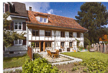
Chatzerüti Hof Hefenhofen, 2014