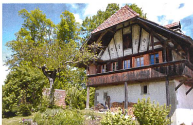
Ofenhausstöckli Zimmerwald, 2014

petite ferme du XVI e siècle, typique de la région, a été rénovée en collaboration avec le Service de la conservation du patrimoine.