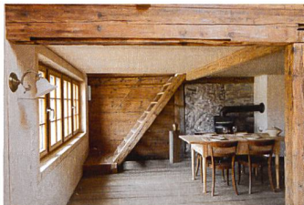
Bödéli-Huus Bönigen, 2013