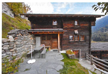
«Schloss» Niederwald, 2009

Bereits zehn historische Ferienhäuser mit zwölf Wohnungen stellt die Stiftung Ferien im Baudenkmal zur Verfügung. Neu ins Angebot kommt das erste Tessiner Baudenkmal, die Casa Döbeli in Russo TI. Ein besonderes Highlight ist die Nomination der Stiftung Ferien im Baudenkmal für den Milestone 2010 . Dieser Preis wird von der Hotelrevue , dem Seco und dem Schweizerischen Tourismusverband jedes Jahr an Projekte vergeben, welche als besonders innovativ in der Schweizer Tourismuslandschaft angesehen werden.