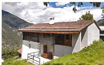
Belwalder-Gitsch Hüs Grenchols, 2014