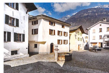
Ciäsa Picenoni Cief Bondo, 2015

Dès le mois de janvier, un séjour dans la Schindelhaus d'Oberterzen (SG) offre à des vacanciers la possibilité de découvrir comment faire rimer confort moderne avec préservation du patrimoine bâti. A partir du mois de mars, la Ciäsa Picenoni Cief accueille des touristes d'ici et d'ailleurs à Bondo (GR), village du val de Bregaglia qui vient de recevoir le Prix Wakker. Un partenariat de coopération conclu avec e-domizil, spécialiste de la location de vacances, permet à la fondation de disposer d'un système moderne de réservation fonctionnel dès le printemps.