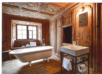
Türalihus Valendas, 2014

Dès le mois de juillet, la Bödéli-Huus, située à Bönigen, près d'Interlaken (BE), est mise en location. Cette ferme traditionnelle datant du XVIII e siècle est un exemple de construction polyvalente typique de la région. Le catalogue de locations s'étoffe dès le mois de novembre de la Chatzerüti Hof, située dans un hameau proche d'Hefenhofen (TG). La fondation enregistre pour la première fois plus de 10 000 nuitées en un an.