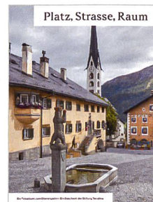
Stiftung Terrafina Oberengadin (Hg.): Platz, Strasse, Raum. S-chanf 2014, 40 S., PDF-Download unter www.terrafina.ch