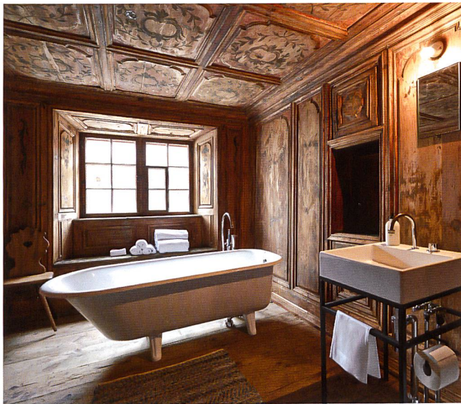
▲ TÜRЛИHUS, VALENDAS (GR)