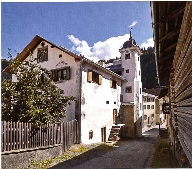
▼ STÜSSHOFSTATT, UNTERSCHÄCHEN (UR)