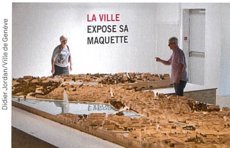
Didier Jordan/Ville de Genève

La Ville de Genève expose sa maquette et propose un regard croisé en trois phases sur cet outil. La première phase de l'exposition a présenté la maquette sous l'angle de l'aménagement du territoire et de l'urbanisme. La deuxième phase montre (du 16 septembre au 12 décembre 2015) les principales réalisations et certains projets de constructions et d'aménagements menés par la Ville de Genève. Quant à la troisième phase (du 20 janvier au 28 mai 2016), elle dévoile la maquette dans son entier (145 modules de 60 x 80 cm), ce qui correspond à un territoire réel de 16 km 2 . La maquette est le résultat de près de 30 années de travail minutieux pour reconstituer, quartier par quartier et à l'échelle (1:500), la ville de Genève en constante évolution. Des visites guidées seront organisées tout au long de l'exposition, sur réservation.