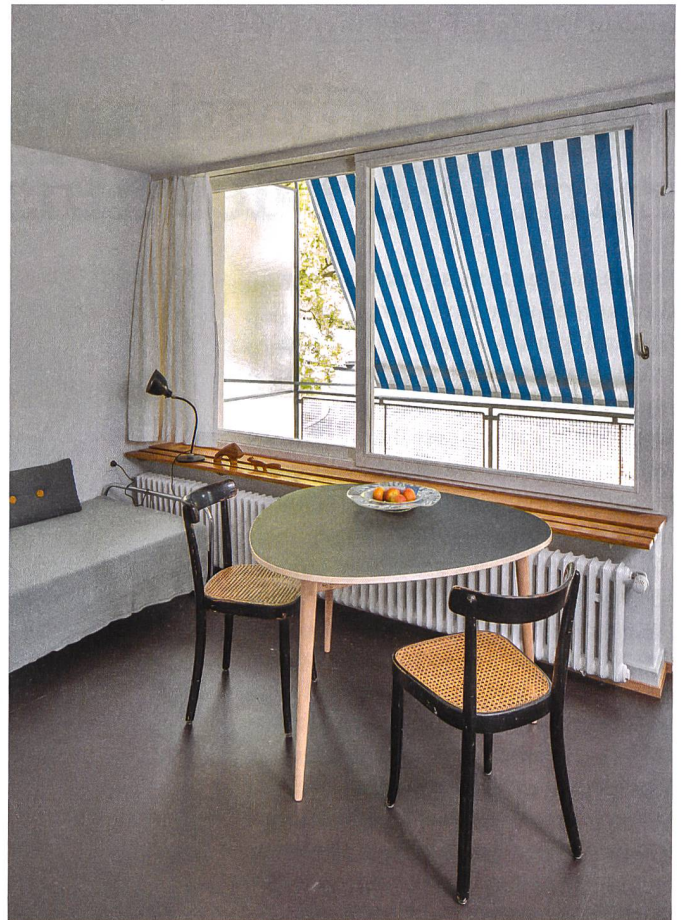
Urs Siegenthaler, Kantonale Denkmalpflege Zürich

→ Mehr zum Wohnungsangebot unter www.magnificasa.ch