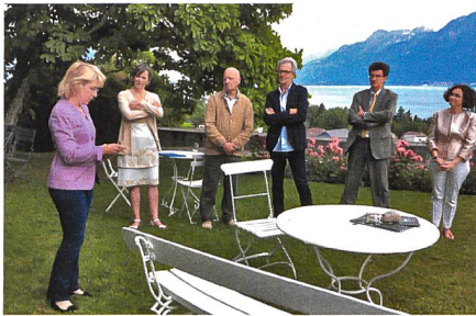
Patrimoine suisse Vaud