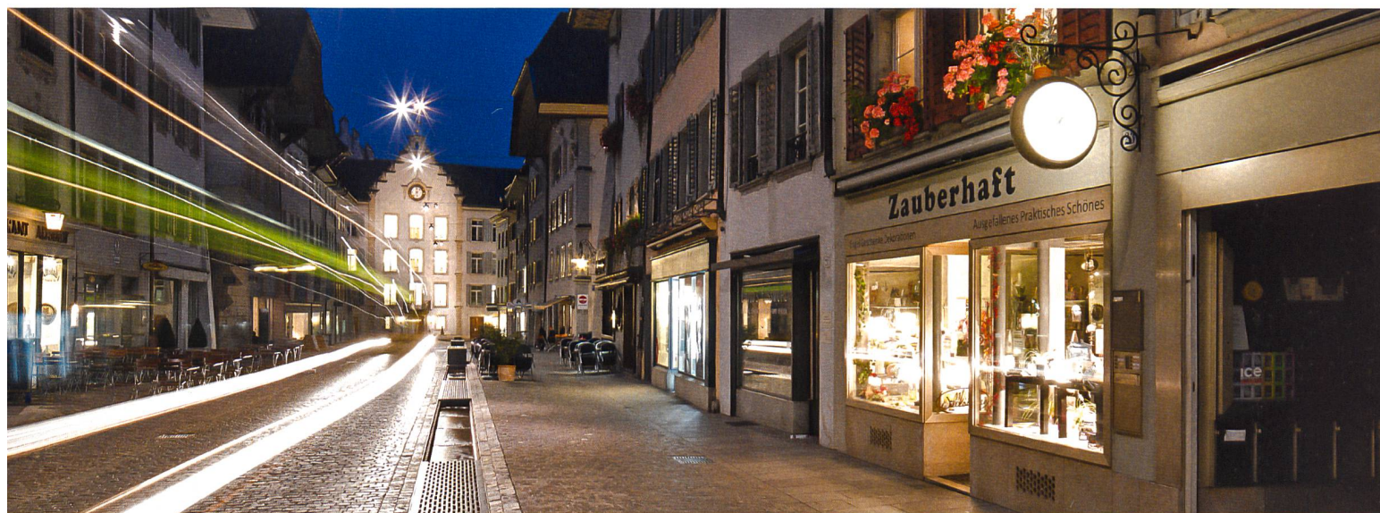
En 2014, Aarau a reçu le Prix Wakker décerné par Patrimoine suisse.