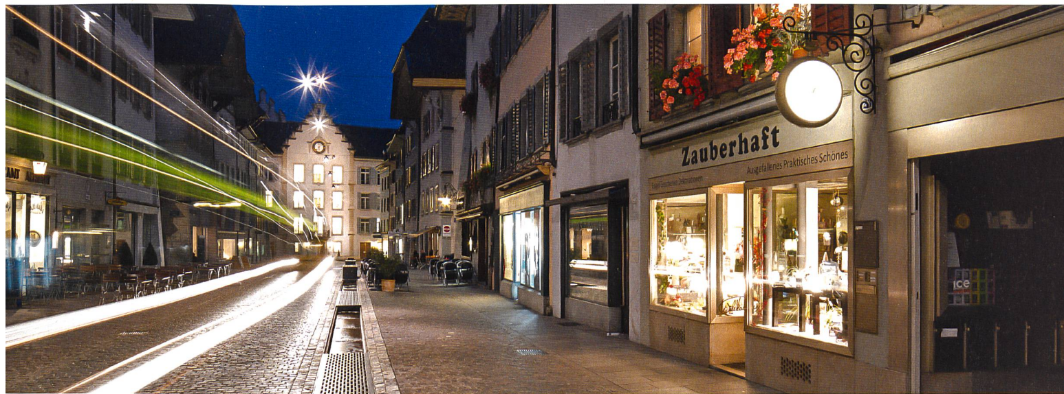
Aarau erhielt 2014 den Wakkerpreis des Schweizer Heimatschutzes.