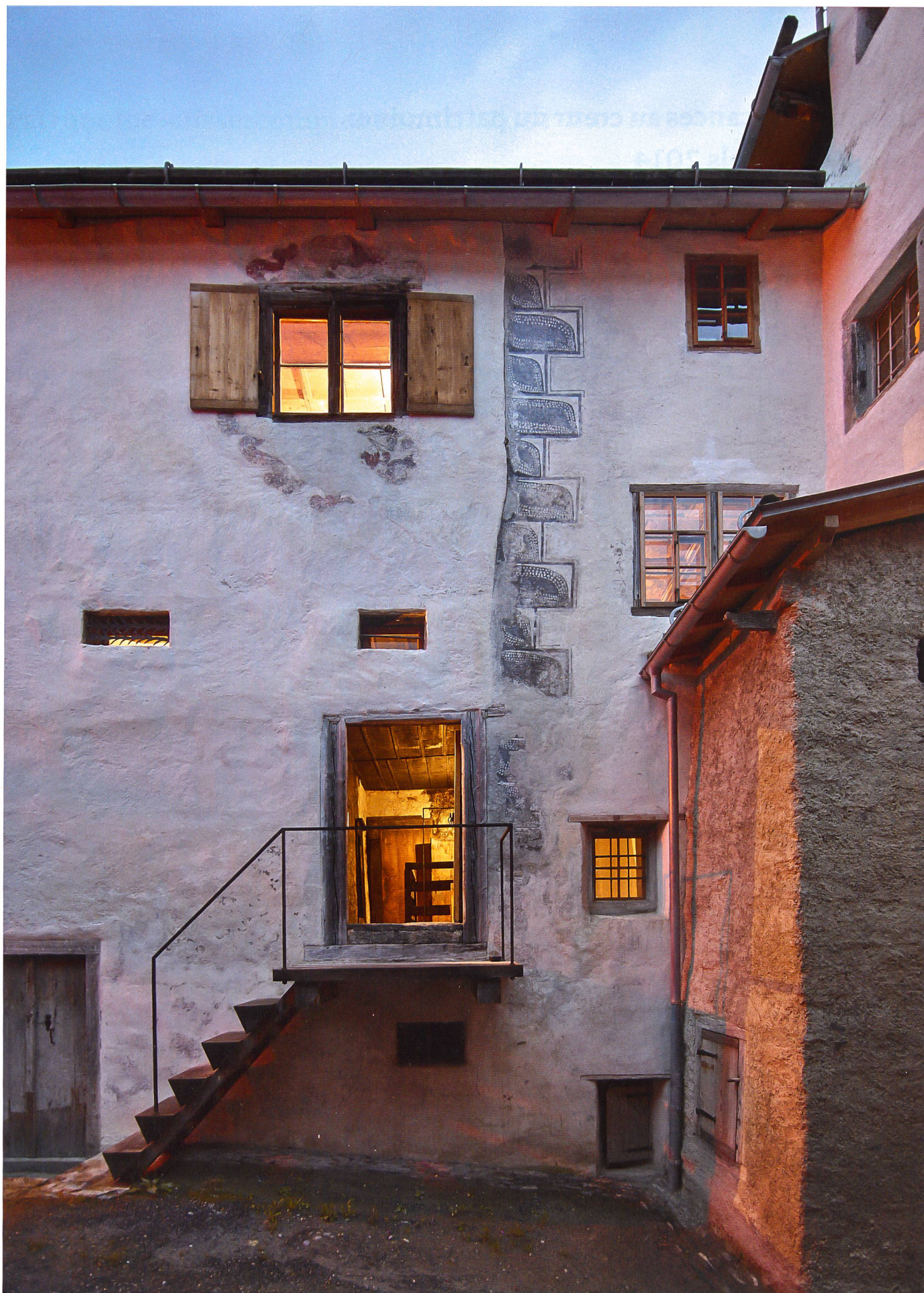
Depuis la fin octobre 2014, Vacances au cœur du patrimoine propose la location de la Turalihus de Valendas (GR), remise en état dans les règles de l'art par les architectes Capaul & Blumenthal.