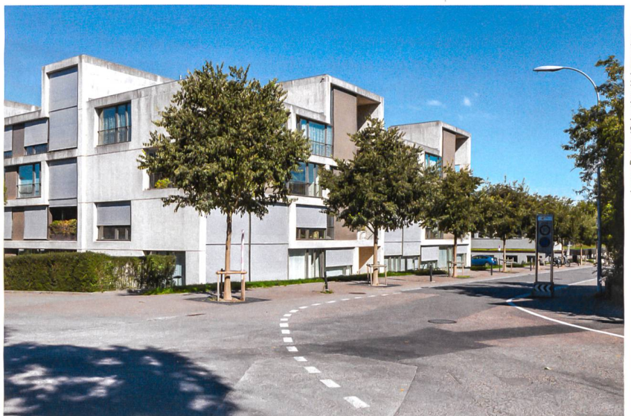
James Batten / Schweizer Heimatschutz

Construit en 2006 selon le système dit «Pile up», cet immeuble d'angle crée une rupture annonçant le nouvel aménagement de la Habich-Dietschy-Strasse. Ce complexe constitue une charnière urbaine entre l'édifice la Kurbrunnenanlage et le quartier très dense du Salmenpark.