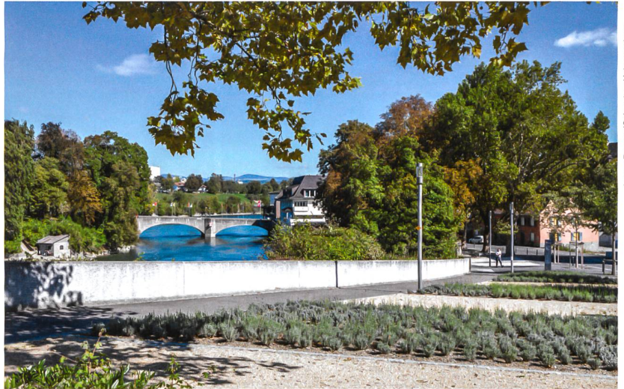
James Batten / Schweizer Heimatschutz

Le nouvel aménagement piétonnier de la Habich-Dietschy-Strasse en promenade a donné le coup d'envoi à de nombreux investissements des propriétaires privés. Un plan directeur a fixé des règles urbanistiques claires et permis une réalisation par étapes cohérente.