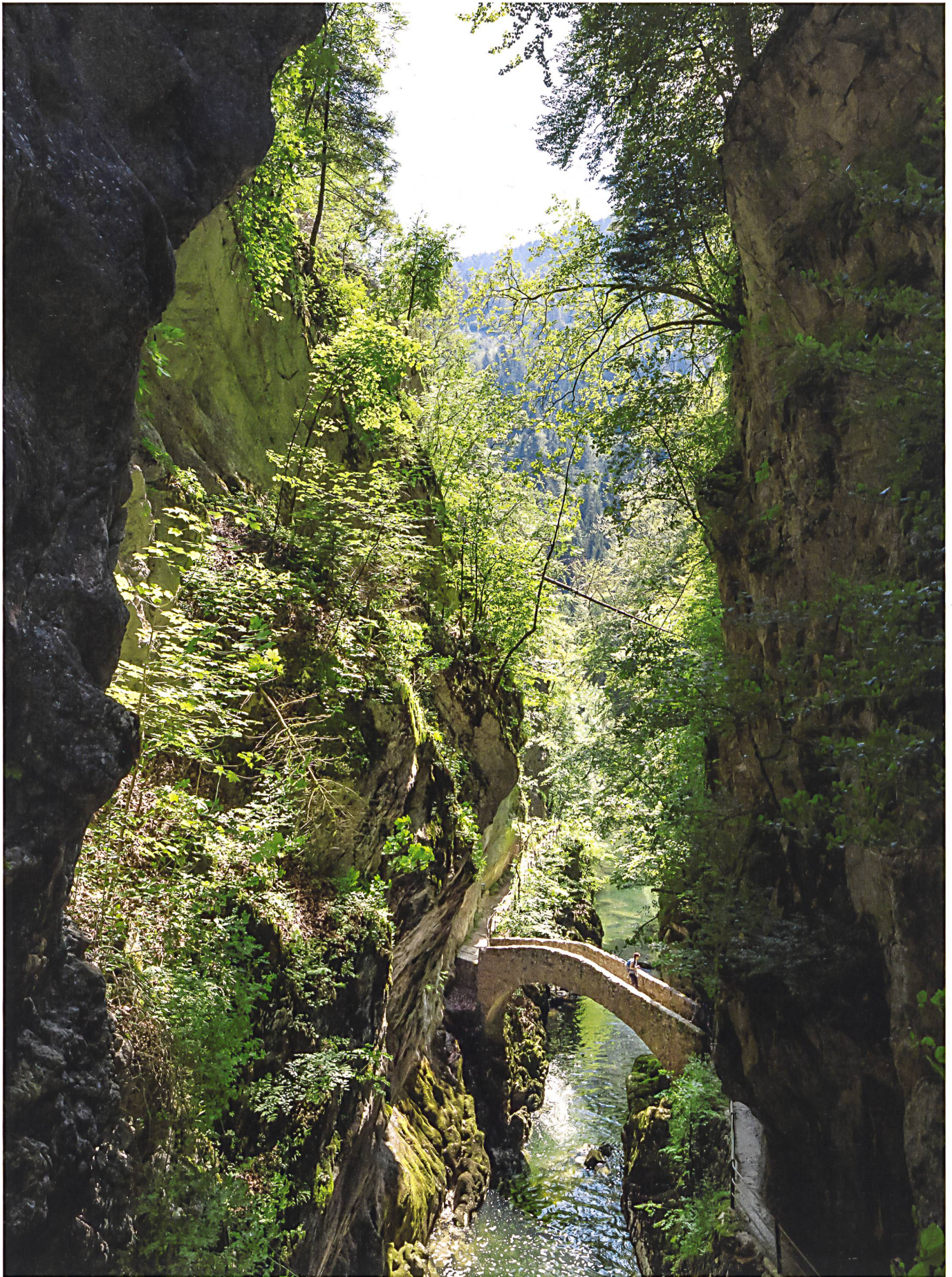
Areuse-Schlucht NE: Route 10 in Heimatschutz unterwegs – Historische Pfade. Über Stege, Brücken, in den Fels gehauene Stufen und künstliche Wassersprünge wurden die topografischen Gegebenheiten regelrecht inszeniert.